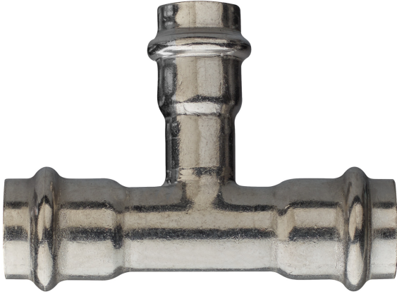
T-Stück reduziert I/I.