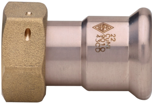
Fitting mit Überwurfmutter.