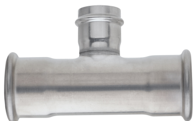
Raccordo a T femmina ridotto.